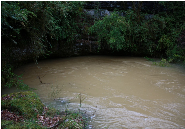
Entrée en crue